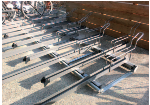
認定第1号となったダイケン「SR-SW-30」

の「SR-SW-30」が誕生しました。今後他の会員メーカー等、認定製品を増やし、「安全・安心」のサイクルラックの整備を進めてまいります。