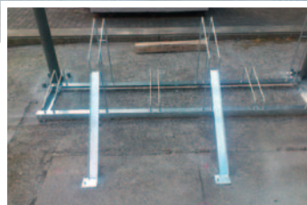
オプションスロープ