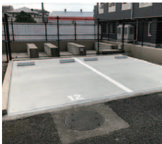
機械式駐車場 平面化

設計・施工からメンテナンス・リニューアルまでトータルにお応えします。機械式駐車場の平面化や、電動自転車・3人乗り自転車対応駐輪場のご提案もお任せください。