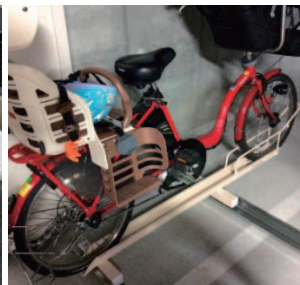
電動・3人乗り自転車対応ラック