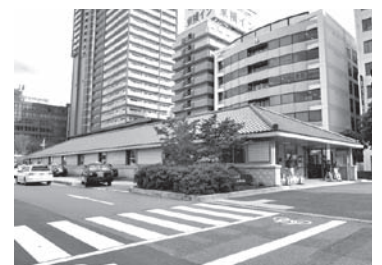
兵庫県・阪神尼崎駅南自転車駐車場