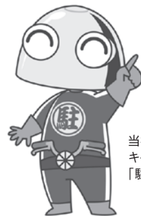
当社マスコットキャラクター「駐輪くん」