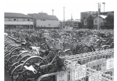
東京都・東小金井南第1自転車駐車場